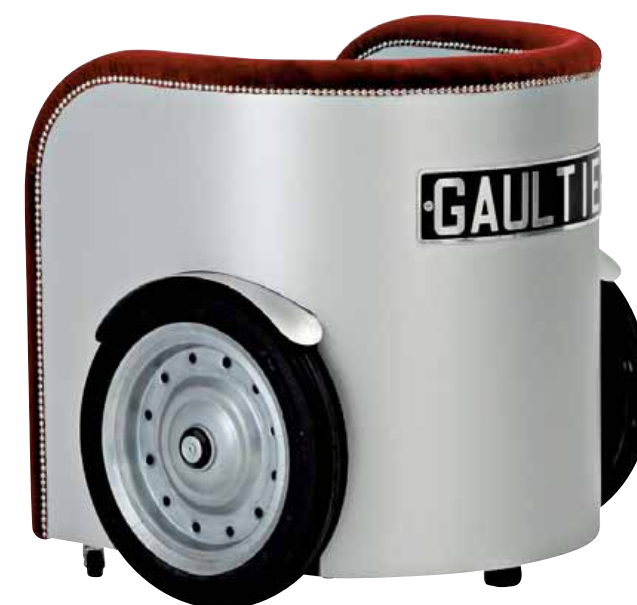
Fauteuil Ben Hur design Jean Paul Gaultier voir index P. 189

Tissu Matelot par Jean Paul Gaultier pour Roche Bobois